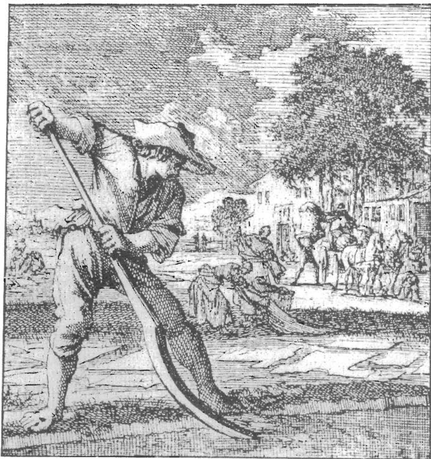
Gravure van 'De Bleker' door Jan Luyken

bevonden zich ook een aantal schilderijen waarvan bij twee vermeld stond, dat zij behoorden tot de bleek (het bedrijf). In de boedelinventaris staan ook alle kledingstukken opgesomd, die van Catharina waren. Hieruit kan afgeleid worden hoe zij rond 1811 gekleed ging. Zij droeg meestal een rok met een los jak er op. Haar garderobe bevatte zowel gebloemde jakken en rokken als effen blauwe, zwarte en grijze zijden rokken (met onderrokken). Uit de hoeveelheid mutsen met kant is af te leiden, dat zij dagelijks een muts droeg.