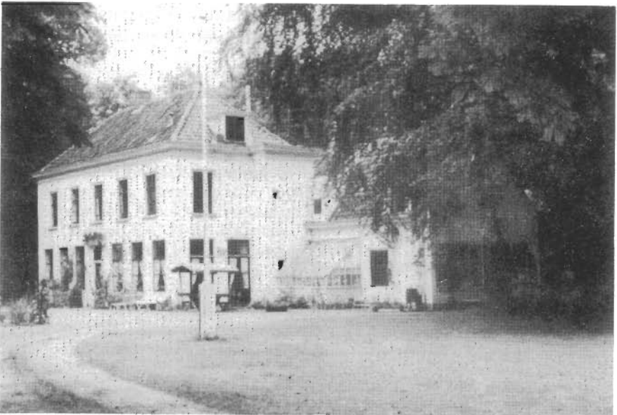
De Gliphoeve op een foto uit omstreeks 1990.